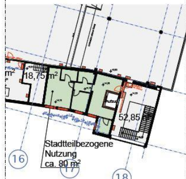
Ausschnitt Zwischengeschoss Süd-Ost