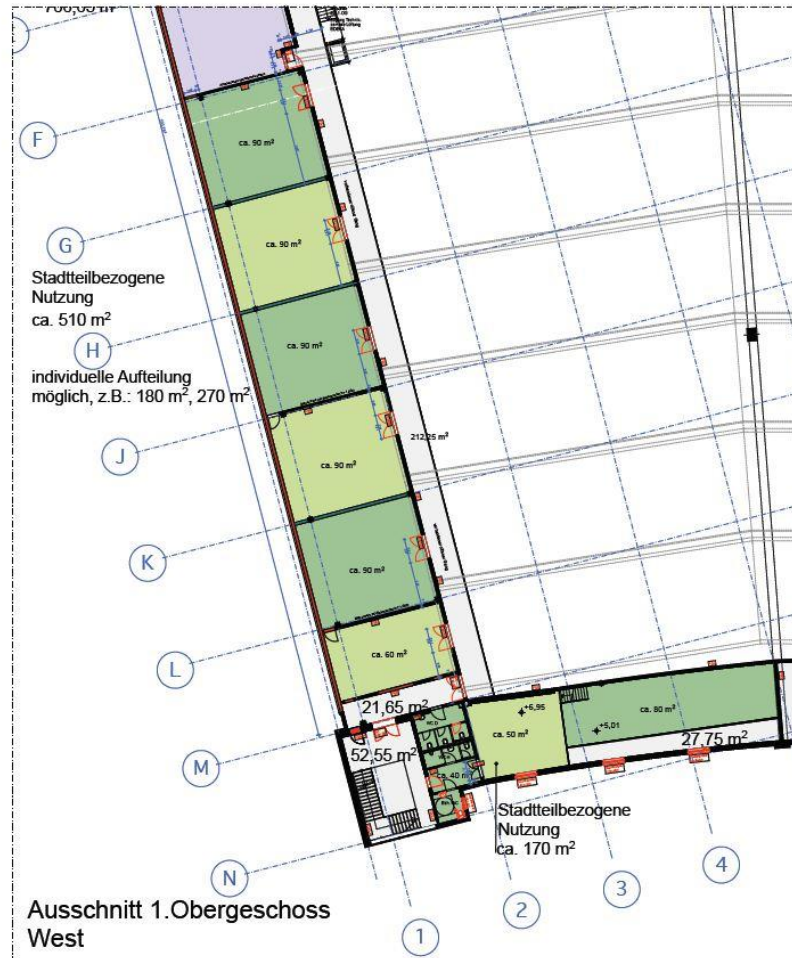
Ausschnitt 1. Obergeschoss West